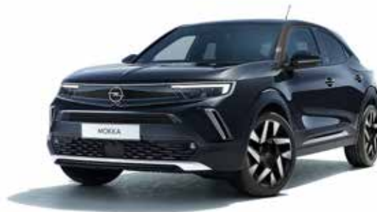
Diamond Black Elegance